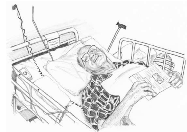
本文イラストより